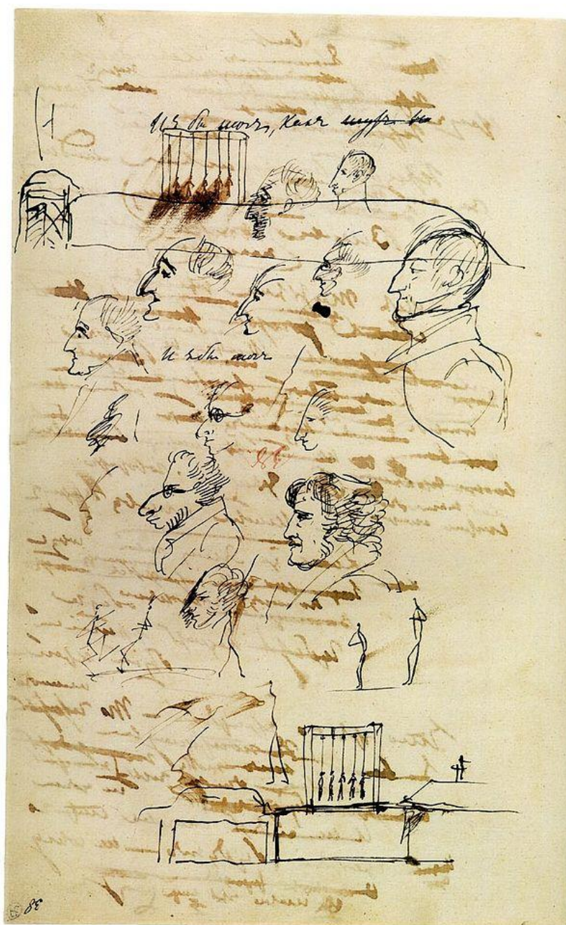
«И я бы мог как [шут ви...]» Рисунок Пушкина. Осень 1826. – URL: https://ru.wikisource.org/wiki – (Дата обращения: 20.11.2022).

Keywords: Decembrists, historico-semantic analysis, A.S. Pushkin, K.F. Ryleyev, W. Shakespeare, jester.