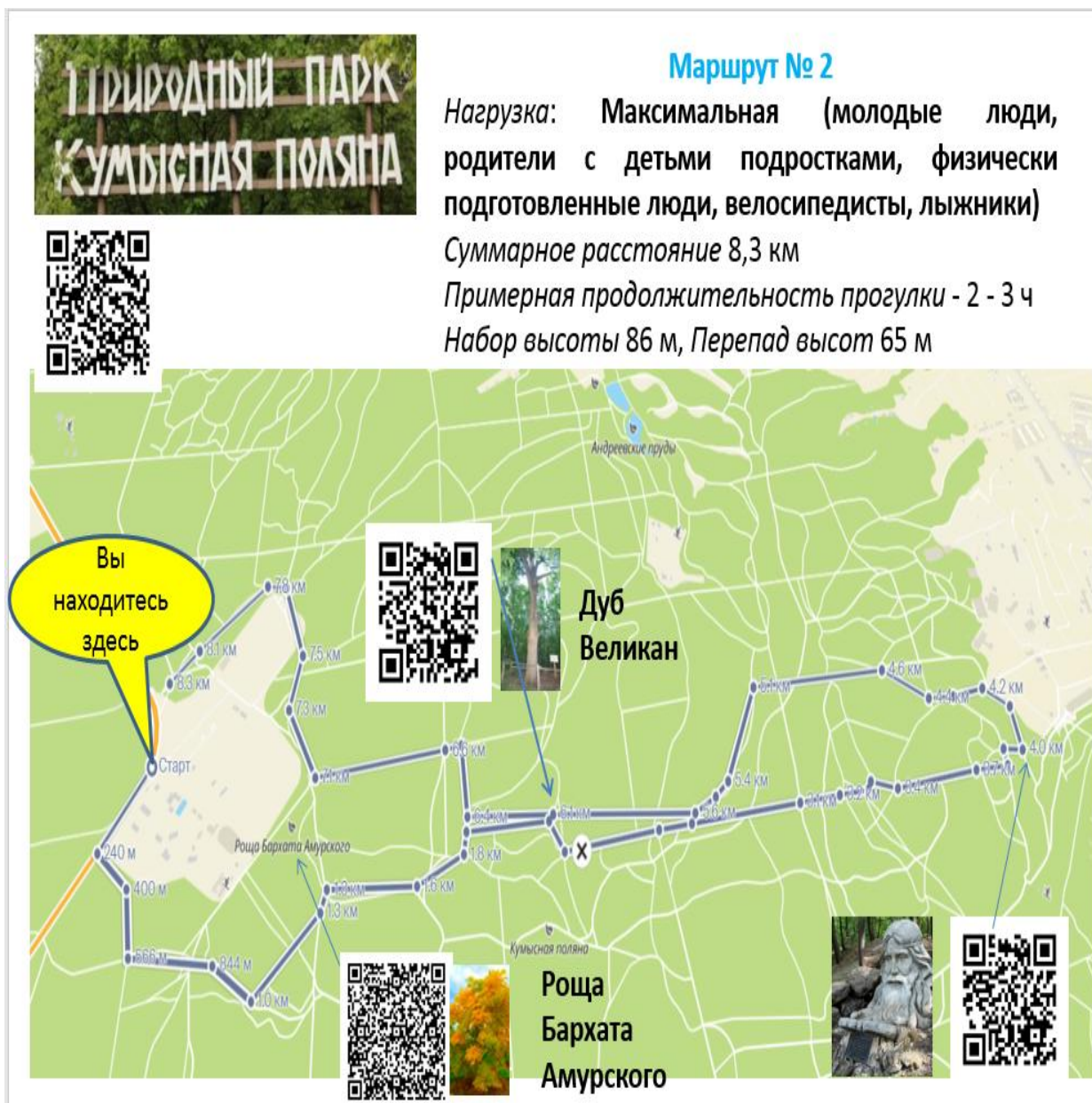
Рис. Маршрут № 3. Остановка ДОЛ «Березка»- «Родник Серебряный»