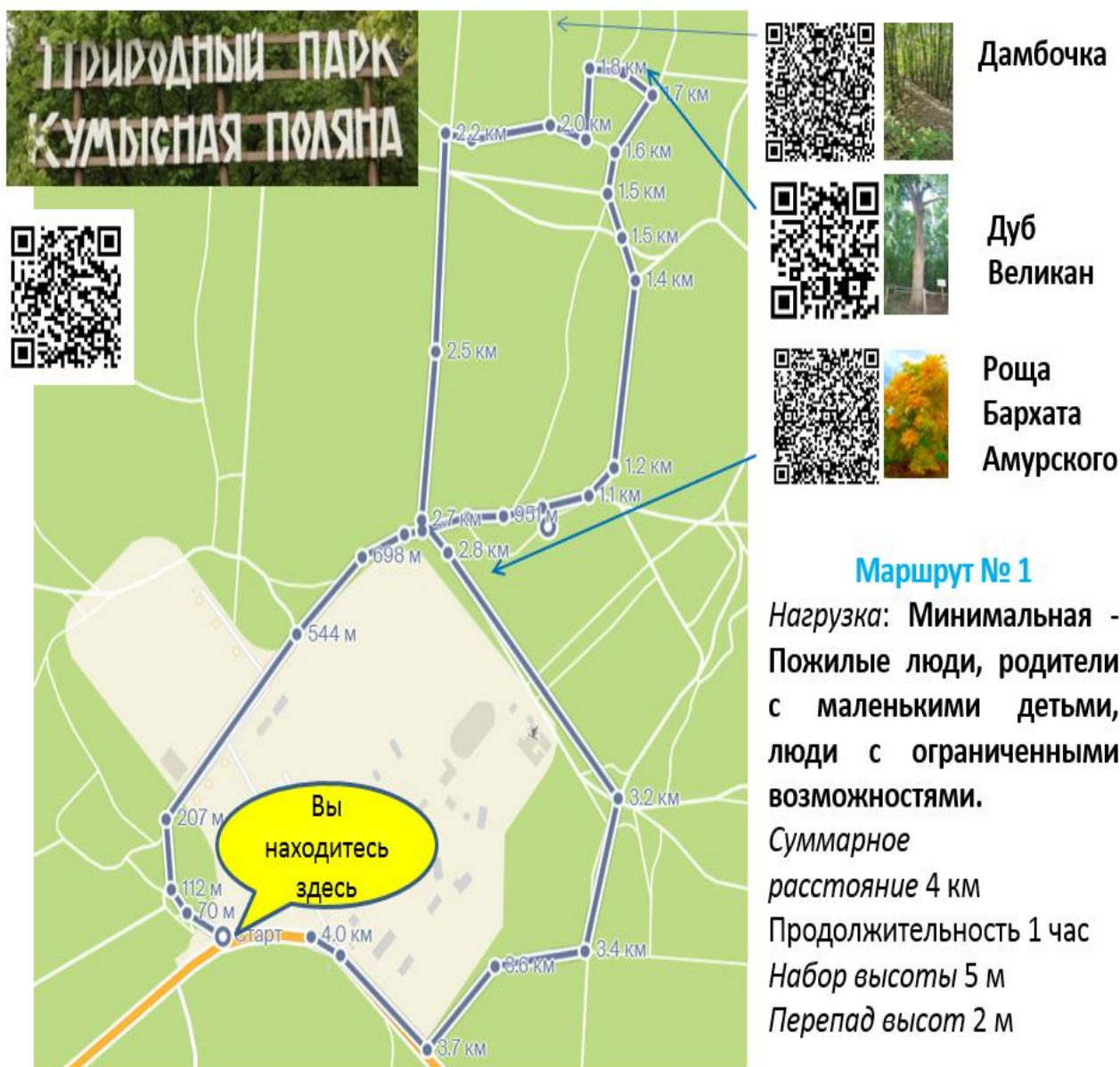
Рис. Маршрут № 1 Остановка - окрестности ДОЛ "Березка"

Описание: Маршрут № 2 пролегает по ровной местности и живописным склонам ущелья со спусками и подъемами, по широким грунтовыми дорогам, предполагает посещение родников и водоемов.