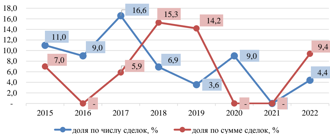
Рис. 1. Доля финансового сектора к общей сумме и общему числу сделок слияний и поглощений в России в 2015-2022 гг., % к итогу (составлено по материалам информационного агентства АК&М [2])

(данные о доле по сумме сделок в 2016 г., 2020 г. и 2021 г. отдельно по финансовому сектору отсутствуют). Можно отметить, что в целом за указанный период доля слияний и поглощений в финансовом секторе по сумме сделок выросла (на 2,4%), а по числу сделок снизилась (на 6,6%), т.е. сделок становится меньше, но при этом они выросли в стоимости, что отчасти объясняется продолжительной консолидацией банковского сектора и рынок уже достаточно сконцентрирован между крупнейшими финансовыми корпорациями и системно значимыми кредитными организациями.