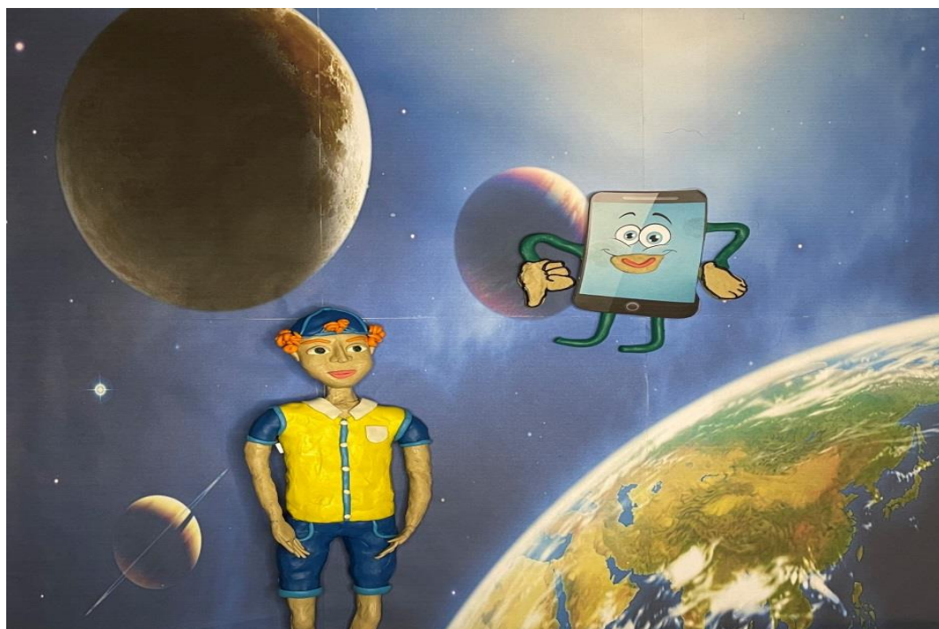
Рис. 1 – Главные герои мультфильма

С целью обогащения словарного запаса младших школьников географическими названиями был создан мультфильм «Потерянный подарок, или Что такое топонимы». Сюжет его построен просто: главные герои, мальчик Славик и Топонимайзер, путешествуя в поисках подарка, оказываются в разных городах (Москве, Санкт-Петербурге, Саратове), узнают об их истории, знаменитых улицах и памятниках. В каждой из локаций им необходимо выполнить задания появляющихся второстепенных персонажей.