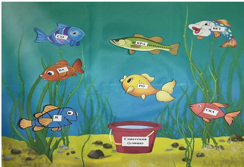
Рис. 4 – Задание 3

Задание 3. Необходимо поймать рыбок, позволяющих составить название улицы города. Данное задание направлено не только на ознакомление с топонимами, но и фокусирует внимание детей на делении слова на слоги, развивает аналитическое мышление, навыки анализа и синтеза.