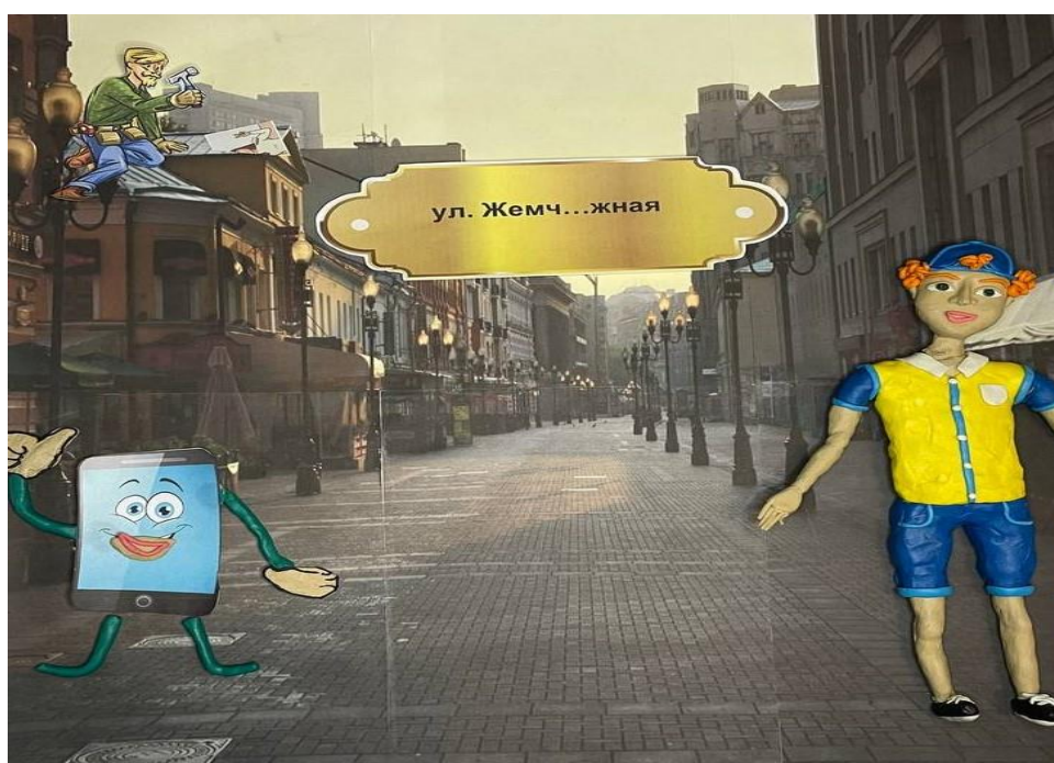
Рис. 3 – Задание 2

Задание 2. Предлагается оформить таблички с названиями улиц города, вспомнив при этом правила написания «ча-ща», «чу-щу», «жи-ши», следовательно, помимо обогащения словаря топонимами, решаются и орфографические задачи.