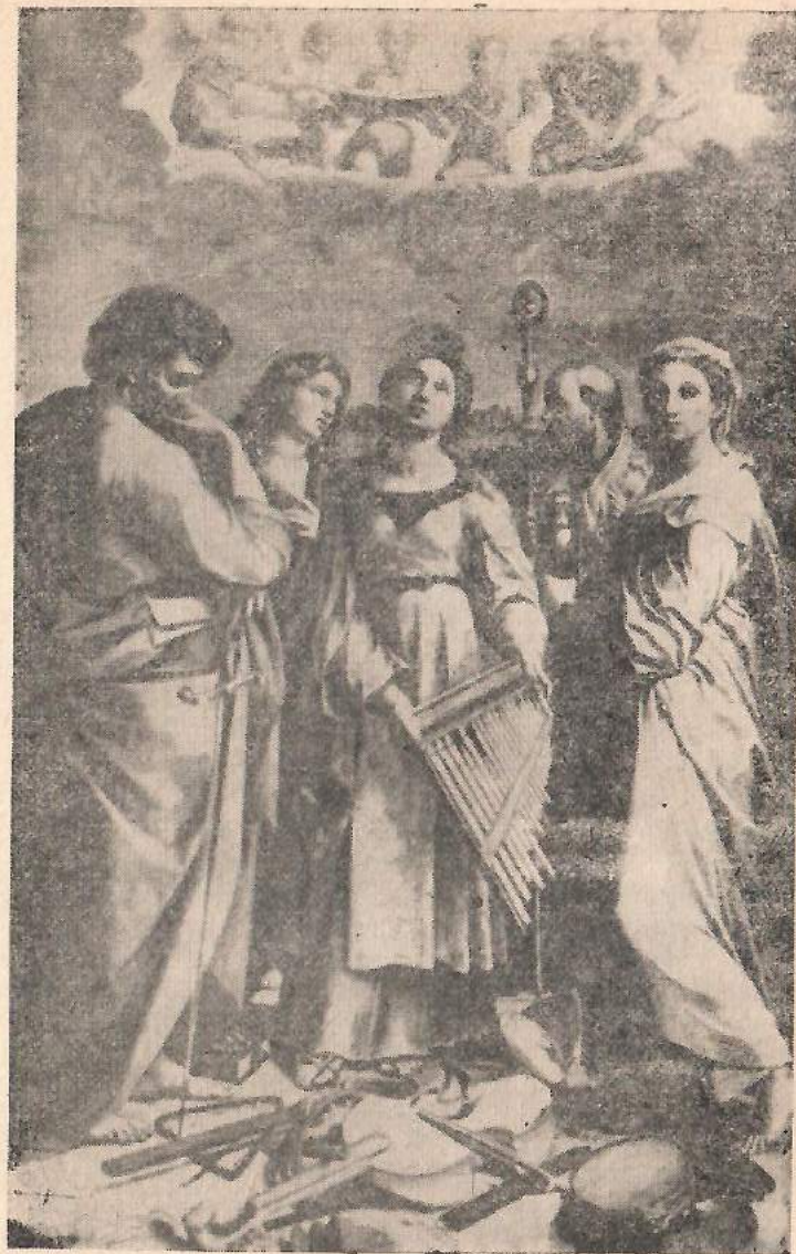
Рафаэль. Святая Цецилия (1514—1515, Болонья, Пинакотека)