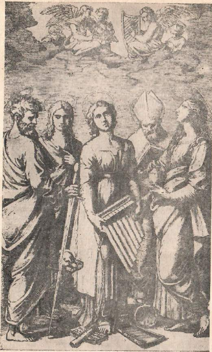
Маркантонио Раймонди. Святая Цецилия (гравюра по рисунку Рафаэля)

вольное переложение готовой картины гравёром? Маркантонио приехал в Рим в 1510 г., близко сошелся с Рафаэлем и тесно сотрудничал с ним, весьма точно воспроизводя в гравюре его рисунки и картины. Глубокое уважение гравёра к великому художнику исключало возможность вольного обращения с его оригиналами. Что Маркантонио копировал какую-то работу мастера, свидетельствуют буквы «Raph» на бортике брошенных цимбал. Очевидно, это копия с подготовительного рисунка Рафаэля к картине, который он, по всей видимости, возил в Болонью в 1515 г. В пользу этого вывода говорит и некоторая вялость композиции нижней сцены и гораздо меньшая, чем на картине, выразительность лиц. Сопоставление позволяет яснее понять, что именно не понравилось боголюбивым болонским заказчикам на рисунке и каких исправлений они потребовали от художника: почему полностью снятыми оказались и горячая мольба Магдалины, и сочувствие к ней ангелов, а сами они из музыкантов превратились в вокалистов.