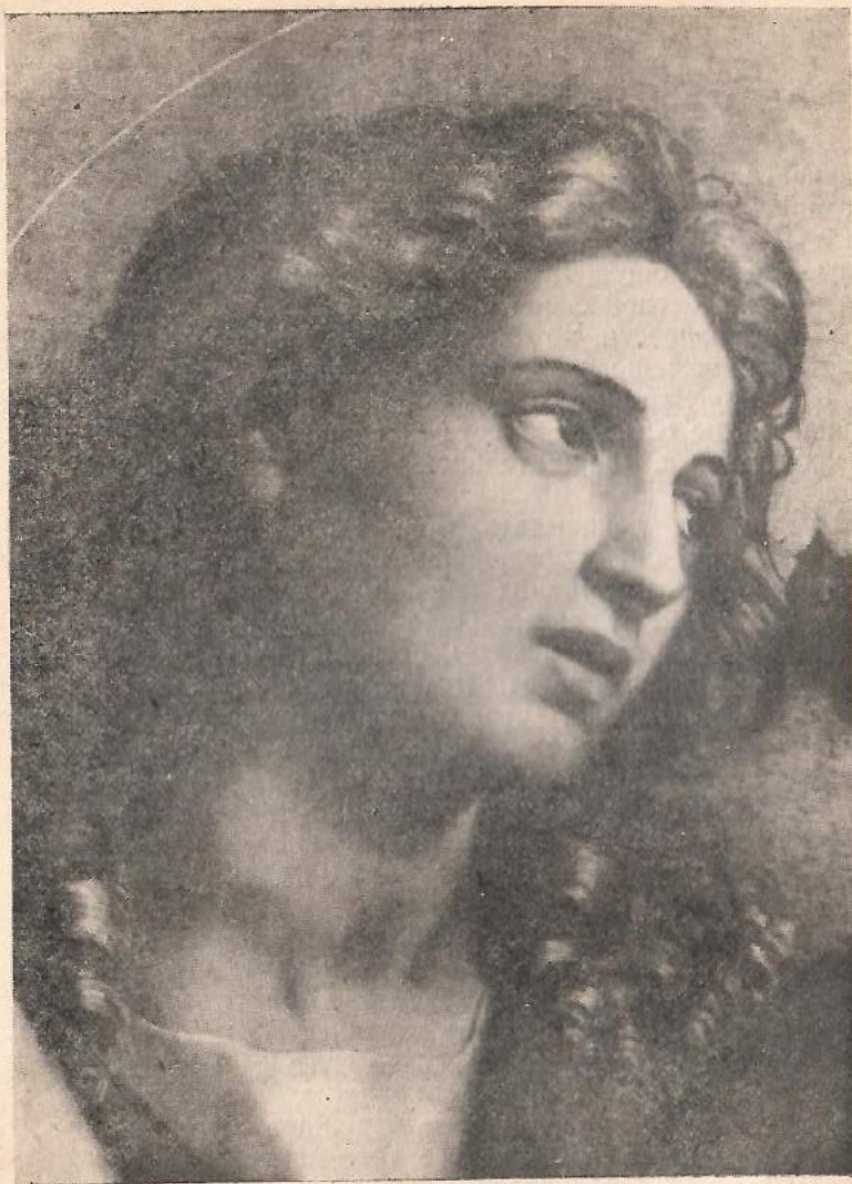
Рафаэль. Святая Цецилия (деталь: апостол Иоанн)