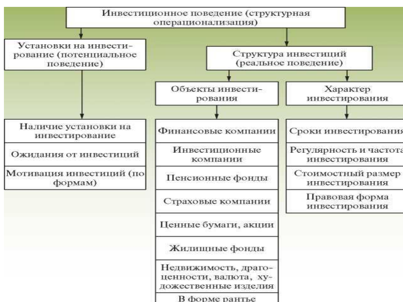
Рис.1. Логическая схема структурной операционализации*

выступает в своем, так сказать, неповторимом облике. Например, для разведывательного исследования не требуется глубокой и всесторонней операционализации, что объясняется определенной узостью решаемых им задач. В соответствии с ними, а также с учетом содержания интерпретации исследуемого явления и выбираются операциональные понятия. В описательном и аналитическом исследованиях требования к глубине и объему операционализации значительно усложняются, что обусловлено более весомыми целями и задачами, которые в них ставятся. Так, в процессе разработки программы описательного исследования осуществляется структурная операционализация . Это значит, что логический анализ основного понятия проводится путем его расчленения на составляющие элементы - наиболее значимые характеристики предмета исследования. Такое расчленение показано на рис. 1.