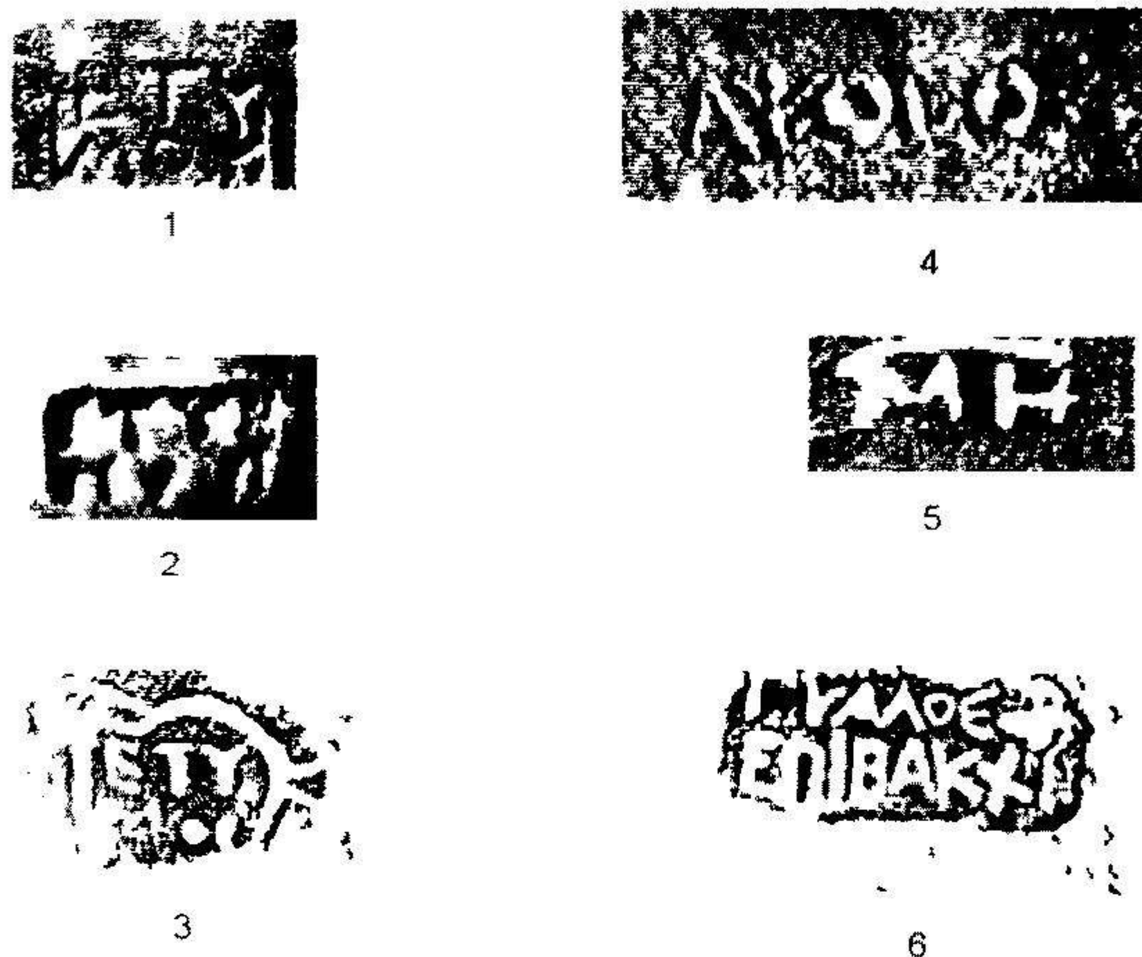
Рис 1 Гераклеийские клейма 1–5 фабриканские, 6– магистратекское

следовании кургана во рву обнаружена амфора с клеймом Этима идентичная той, которая зафиксирована во впускной гробнице (Груммонд, Полин, Черных, Глеба, Дараган 2005 С 276 Рис 2–4) Кроме того, судя по архивным материалам, ещё одно клеймо Апсога было в свое время зафиксировано при раскопках останцов кургана (Груммонд, Полин, Черных, Глеба, Дараган 2005 С 278–279)