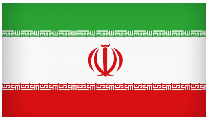
Рисунок 2: Официальный государственный флаг ИРИ с гербом.

историей во времена Ахеменидов 27 . Символически они обозначали единство общества, состоявшего из трех свободных сословий полноправных граждан империи. Население Ахеменидской державы делилось на военную знать («ратайштар», чьим традиционным цветом был красный), духовенство («атраван», соответственно, цвет – белый) и слой свободных общинников, скотоводов и земледельцев («вайштрийя»), ассоциировавшихся с зеленым цветом. Зеленый цвет, к тому же, также указывает на традицию «Пир-э сабз» (зеленый понтификат), обозначающий паломничество к святым местам зороастрийцев близ священного города Йезд. Само древнеиранское слово «пиштра», использовавшееся для обозначения понятия «сословие», также означало слово «цвет».