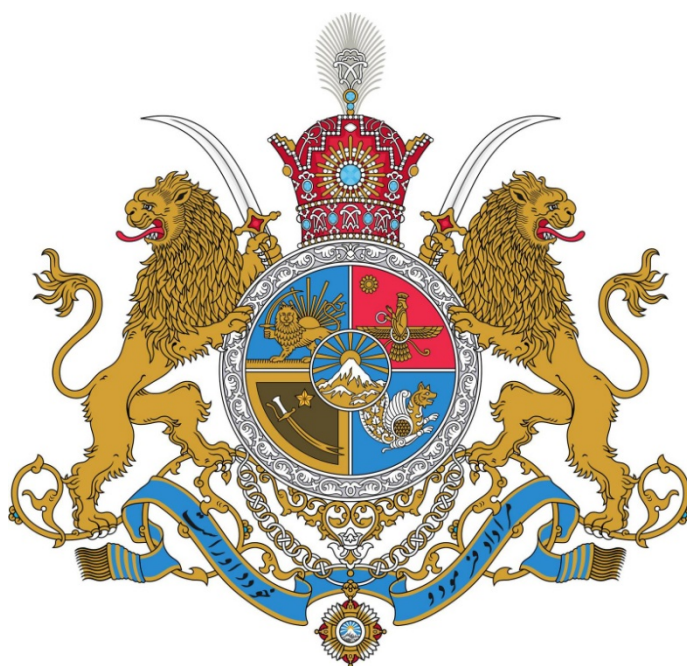
Рисунок 1: Официальный герб Ирана (1956-1979 гг).

При подготовке к торжествам, и при их проведении, активно использовался императорский шахиншахский герб (Рис. 1), который был задействован как никогда прежде. Он был включен в официальную эмблему празднования, появился на высших номиналах юбилейных монет, памятных медалях и так далее.