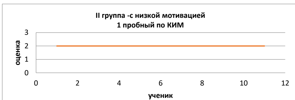
Рис. 2. Оценки учеников 2 группы

Ученики из второй группы все получили «неудовлетворительную оценку».