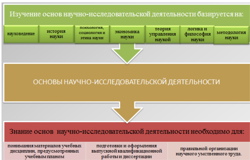
Рисунок 2 – Связь курса с другими дисциплинами