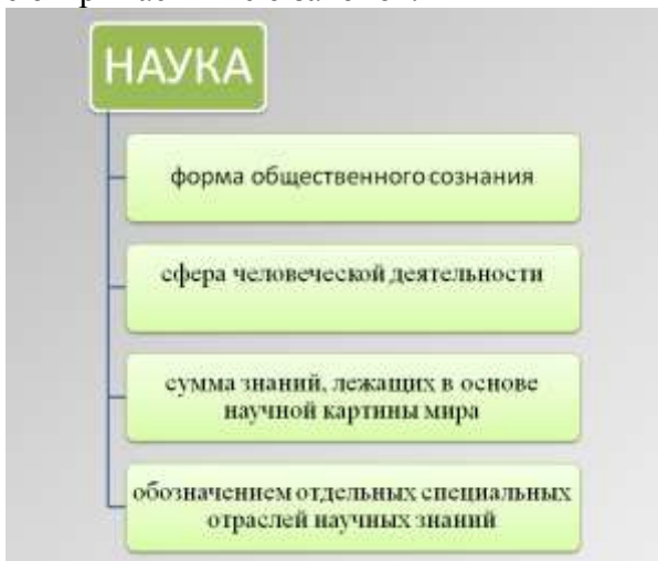
Рисунок 1 – Интерпретации термина «наука»

Непосредственные цели науки – описание, объяснение и предсказание процессов и явлений действительности на основе открываемых ею законов.