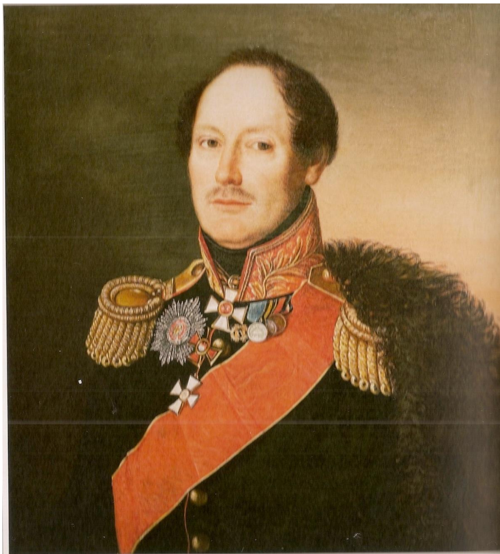
М.И. Карпенко. Неизвестный художник. Первая половина XIX в.

но сохранилась и первоначальная нумерация – это листы 1–13. На первом листе имеется помета: «По Описи № 74». Дело в том, что комиссия, разбиравшая архив ученого, все его «бумаги» тщательно изучила, и отдельные воспоминания получили свой номер.