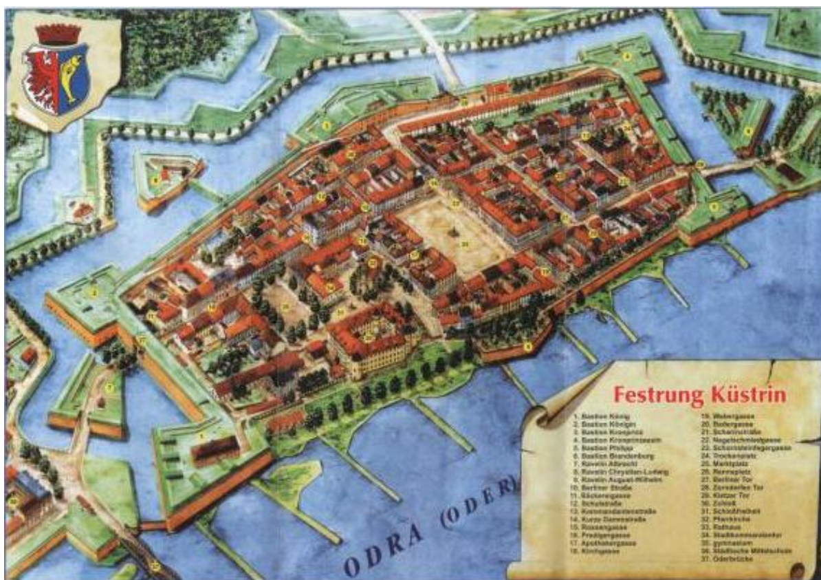
План крепости Кюстрин

Как известно, получив ранение в Бородинском сражении, генерал-майор М. С. Воронцов выехал на излечение в свое имение Андреевское Владимирской губернии. После недолгого отдыха Воронцов был определен в 3-ю Западную армию генерала П.В. Чичагова 1 , получив под командование летучий отряд, который включал сводно-гренадерские батальоны 9-й, 15-й и 18-й пехотных дивизий, 11-ю и 13-ю конные роты, казачью бригаду полковника Г.А. Луковского (3 казачьих полка) и бригаду полковника А.И. Красовского (4 батальона). В июле 1813 г. во время Плесвицкого перемирия приказом главнокомандующего армиями отряд Воронцова поступил «...в начальство Его Королевского Высочества принца Шведского 2 Корпус генерал-адъютанта барона Винцингероде 3 ...».