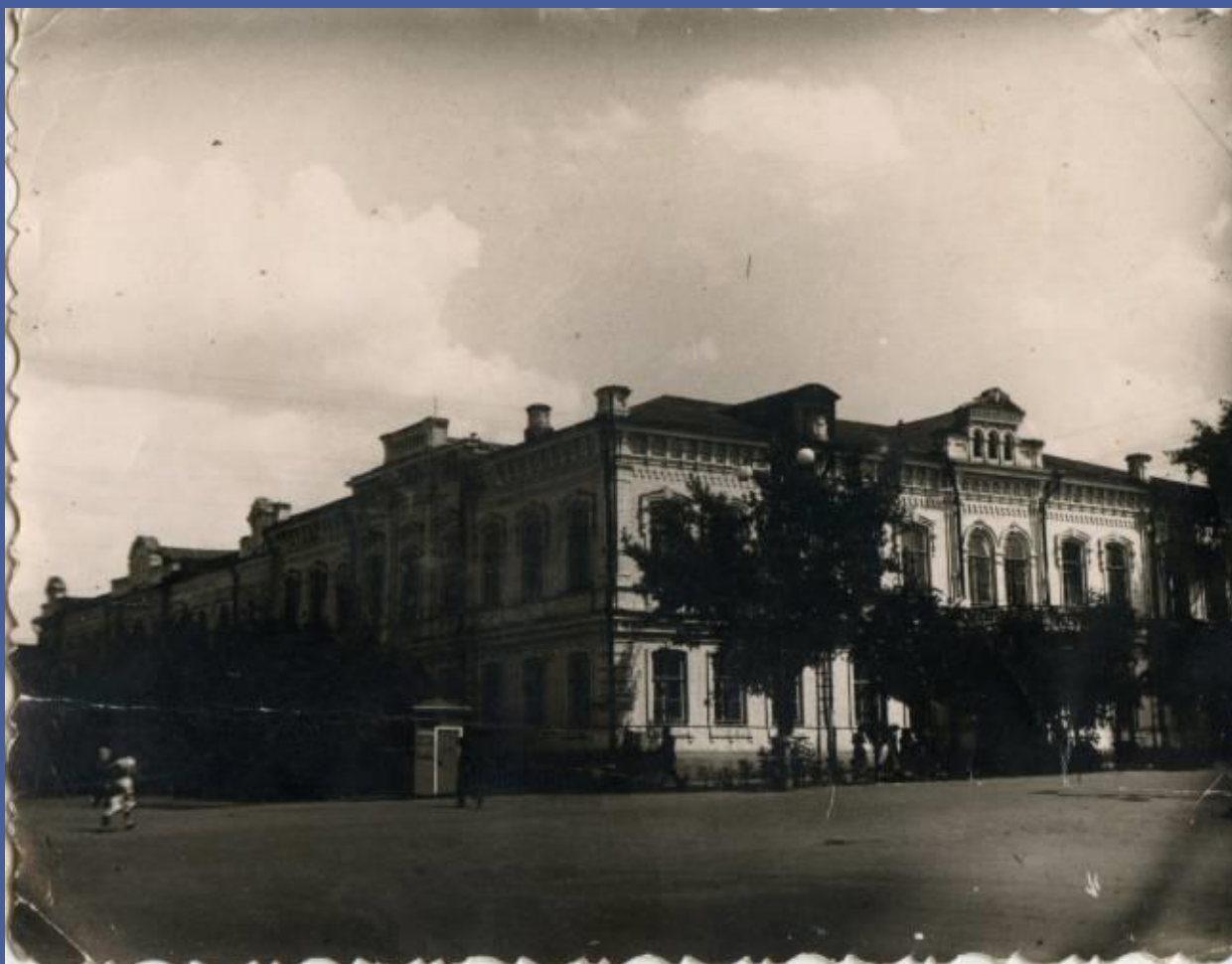
Здание Балашовского учительского института, 1942 г.