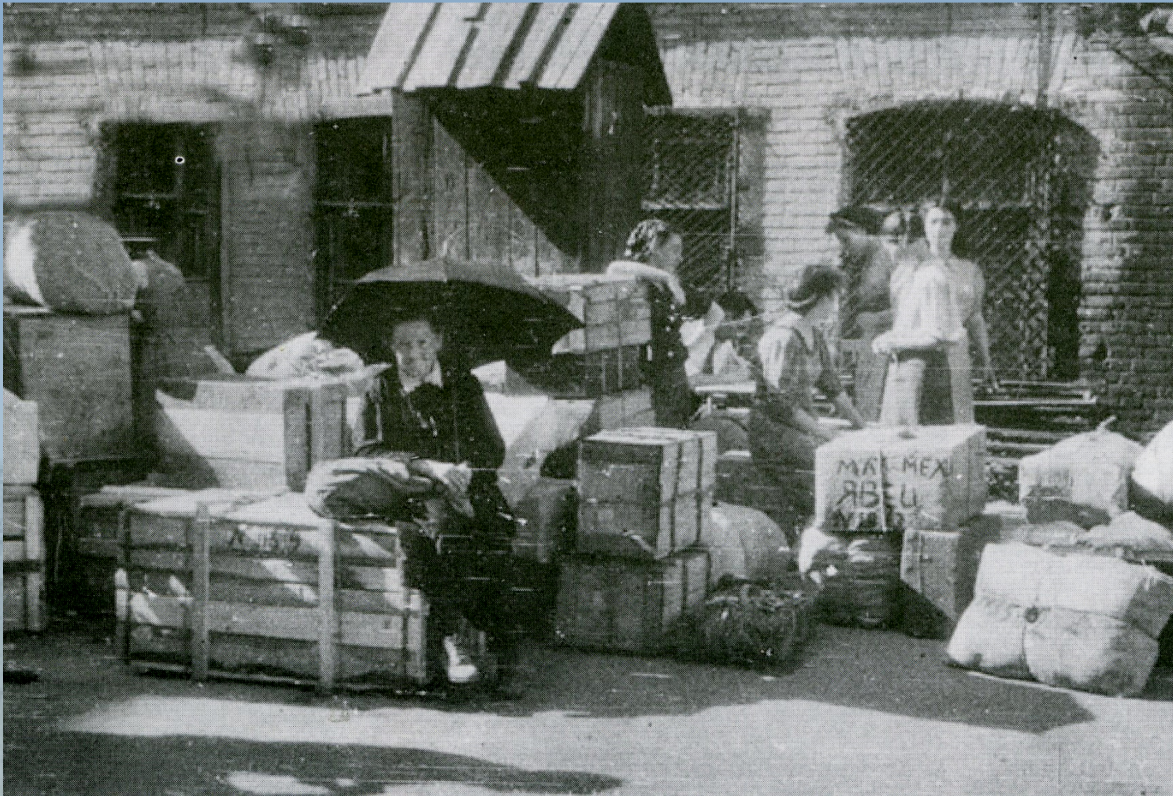
Прибытие студентов и преподавателей ЛГУ 1942 г.

В начале марта 1942 года было принято сообщение о скором прибытии коллектива Ленинградского университета.