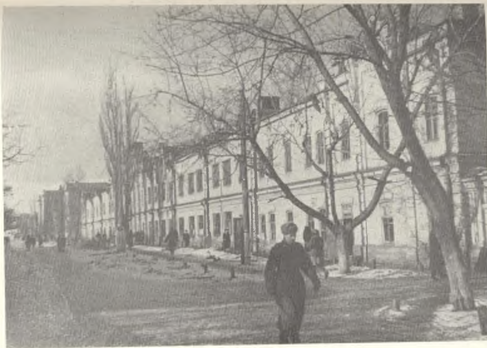
Общежитие Ленинградского университета в Саратове.