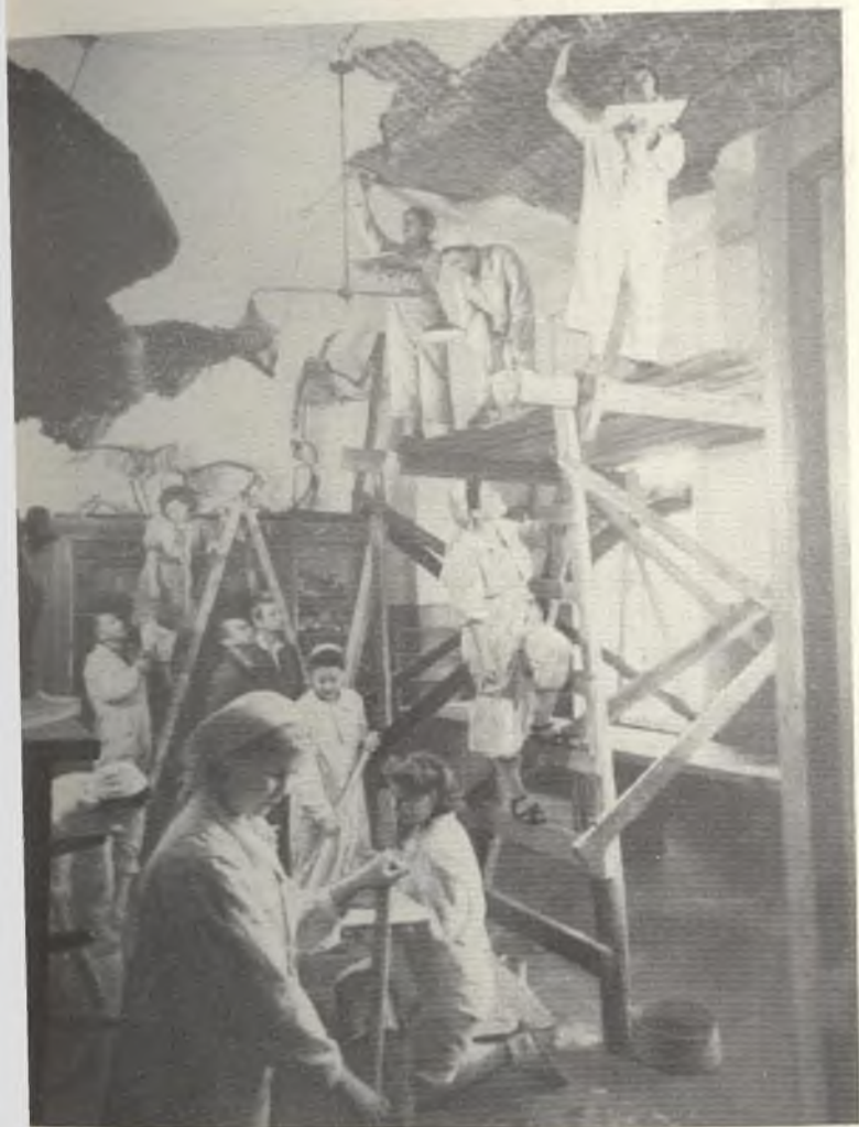
Восстановительные работы в Главном здании университета.