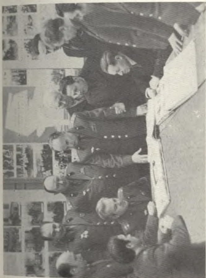
Преподаватели военной кафедры обсуждают план похода по местам боевой славы.