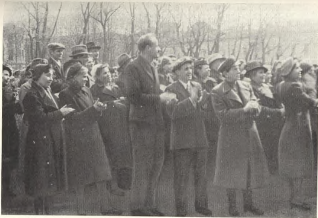
Митинг 9 мая 1945 г. в День Победы на Менделеевской линии.