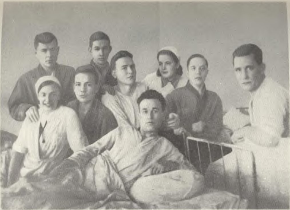
Раненые в госпитале, оборудованном на историческом факультете, История Санкт-Петербургского университета в виртуальном пространстве http://history.museums.spbu.ru/