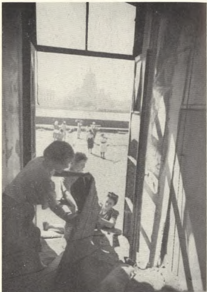
Филологический факультет готовится к первому послевоенному учебному году.