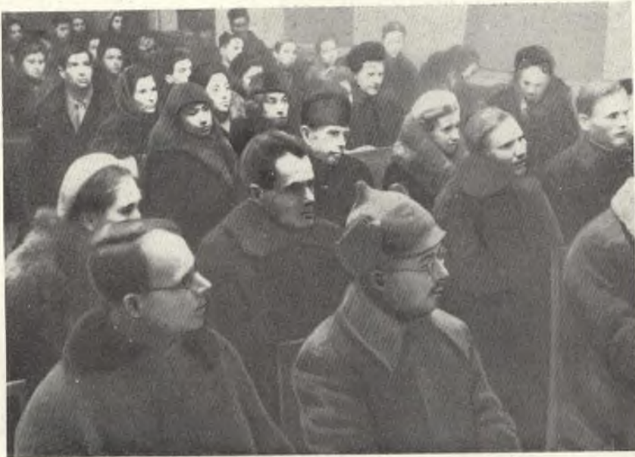
На лекции В. В. Мавродина в Саратове.