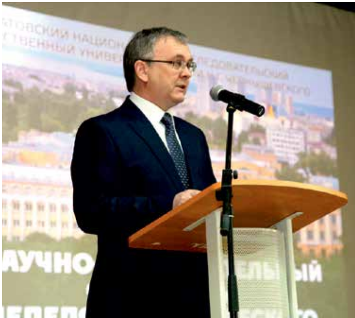
ФОТО ВИКТОРИИ ВИКТОРОВОЙ