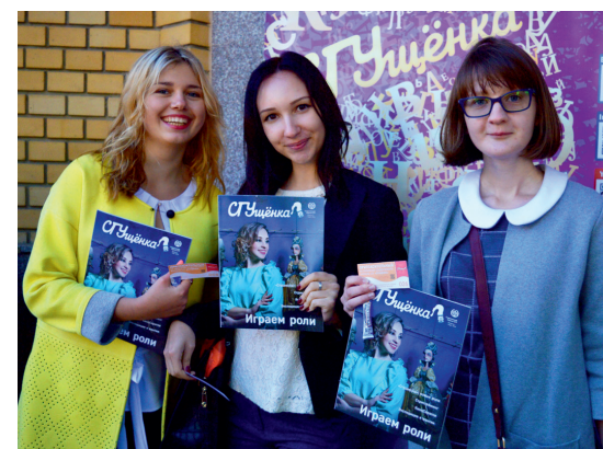
Участники линейки получили номер журнала «СГУщёнка» и сладкий подарок от редакции