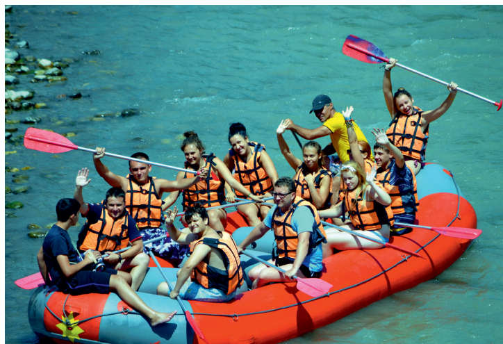
Студенты XXI века продолжают традиции своих предшественников и покоряют как горные вершины, так и бурные реки