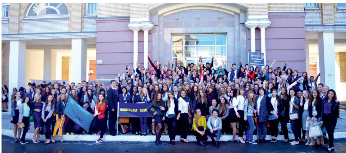
Общее фото будет напоминанием о счастливом дне начала новой жизни первокурсников