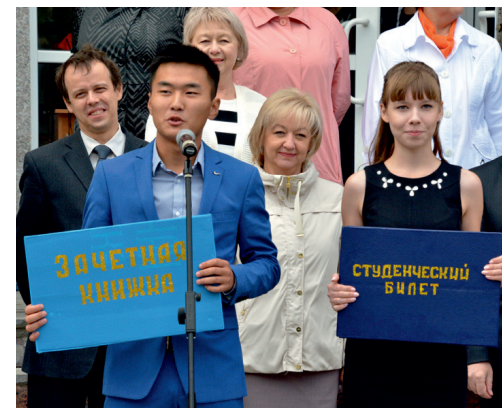
С таким студенческим билетом и зачёткой «новобранцы» обречены на успех