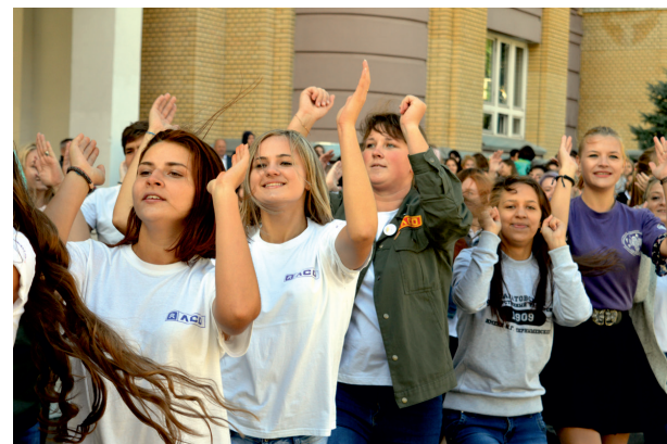
Задорный флешмоб от Совета студентов и аспирантов помог взбодриться и согреться