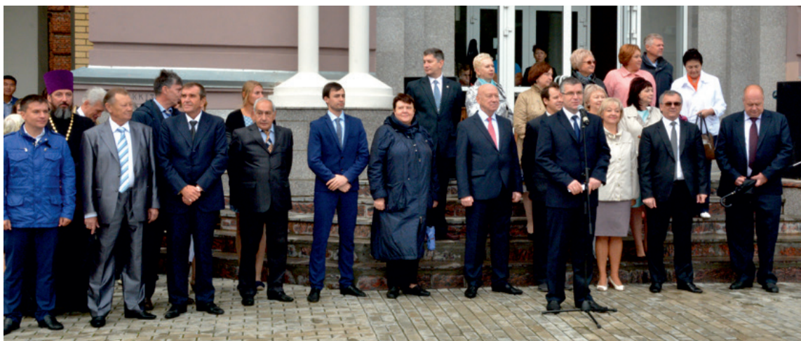
Команда руководства университета поздравила студентов с началом учебного года

Инна ГЕРАСИМОВА