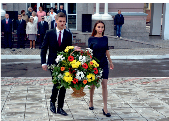
День традиции: студенты возложили цветы к монументу Н.Г. Чернышевского