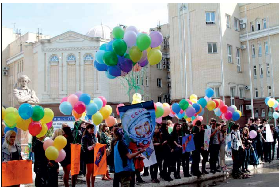
Студенты СГУ ежегодно готовят и проводят на Студенческой площади «Космическую эстафету», приуроченную ко Дню космонавтики