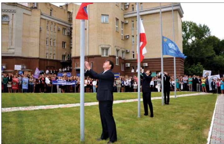
На линейке в небо взвились флаги России, Саратовской области и Саратовского государственного университета