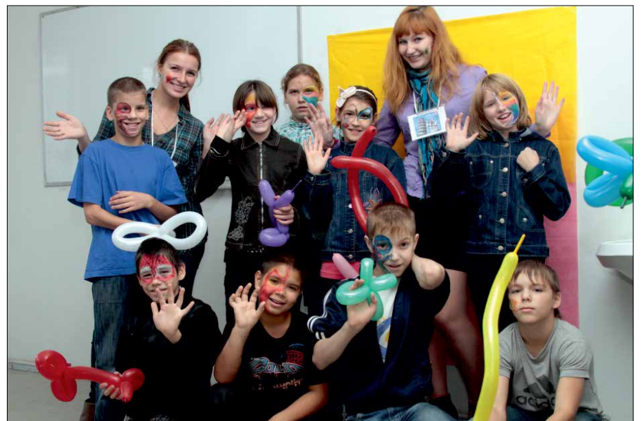
В рамках проектов «УНИВЕРИЯ» и «Учимся жить вместе» для ребят из детских домов Саратова и области была организована благотворительная акция «Планета детства»