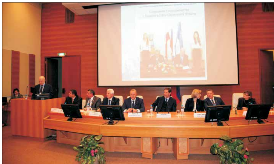
В рамках Дней Саратовской области и выставки достижений региона в Государственной Думе прошло представление Саратовского государственного университета

Университет уверенно занял свою нишу на рынке международных образовательных услуг. Широко развёрнутая интенсивная работа с зарубежными партнёрами, которая велась в 2011 году, привела к росту числа иностранных студентов. В 2010 году в университете обучались два иностранных аспиранта, в 2012 году их число увеличилось до тринадцати. За три года число иностранных студентов выросло вдвое: со 152 до 304. Существенно увеличилось число студентов, приехавших из Турции, Ирака, Туркменистана, Казахстана. В 2011 году в СГУ прибыл первый иракский аспирант – сейчас в Саратовском университете обучаются более двадцати магистрантов и аспирантов из этой страны.