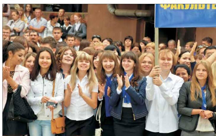
Первокурсники с интересом наблюдали за происходящим на студенческой площади