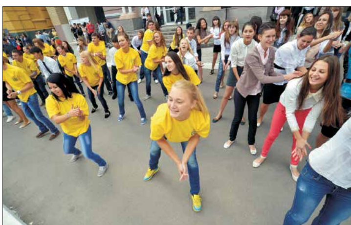
Новые студенты с удовольствием присоединились к танцевальному флешмобу

© «Саратовский университет» №5 (2101) Сентябрь 2013 года gazeta.sgu.ru