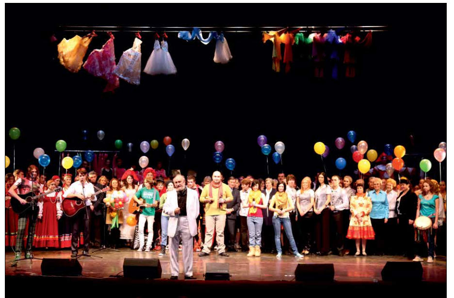
Заключительный юбилейный концерт «Звёзды университетской сцены» прошёл в Саратовском академическом театре драмы с аншлагом

В том же году в эфир телеканала «ТНТ-Саратов» стали выходить еженедельные информационные выпуски телевизионной передачи «...И дальше века...». Программа рассказывает о многогранном мире университета, о том, как активно ведётся в вузе образовательная, научная и инновационная деятельность, как развиваются международ-