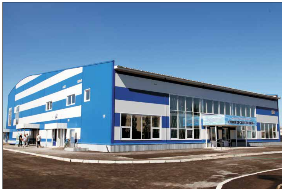
Плавательный бассейн «Университетский» при Балашовском институте СГУ – спортивное сооружение, возведённое с учётом инновационных технологий и возможностей

В 2011 году Саратовский университет успешно прошёл государственную аккредитацию вуза. При проверке впервые действовали разные критерии оценки показателей для разных видов и типов образовательных учреждений. СГУ должен был подтвердить свой статус университета. Кроме того, впервые аккредитация подвергалась не отдельные образовательные программы, а все программы, входящие в укрупнённую группу специальностей и направлений. По новым правилам проверку проходила и аспирантура, а масштабное тестирование студентов проводилось в онлайн-режиме. Экспертизы такого масштаба за сто лет своего существования университет ещё не знал. Аккредитация продолжалась всего пять дней, но подготовка к событию шла в течение нескольких месяцев. И успех этой процедуры связан с кропотливой работой профессорско-преподавательского состава, документоведов, инженеров, системных администраторов, студентов и аспирантов – всего коллектива СГУ. 21 ноября 2011 года Федеральной службой