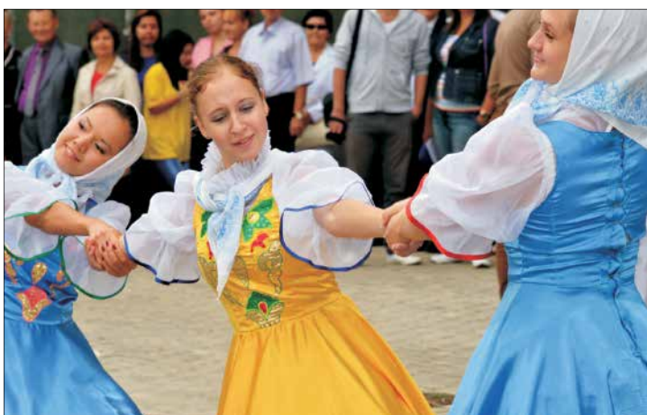
Студенческий клуб СГУ подготовил свой творческий подарок ко Дню знаний