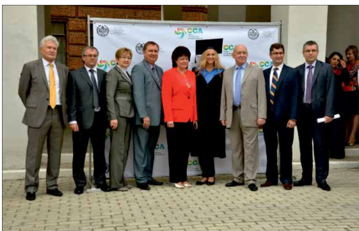
Руководство области и вуза поздравило первокурсников с началом нового учебного года