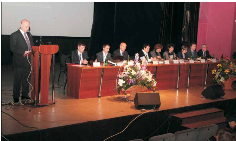
СГУ провёл семинар-совещание по эффективности внедрения ФГОС для работников учреждений профобразования Приволжского федерального округа