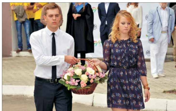
Студенты по традиции возложили цветы к памятнику Н.Г. Чернышевского, имя которого носит университет