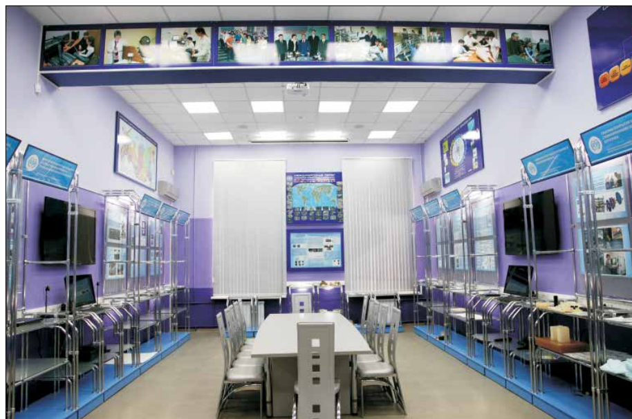
Экспозиция Инновационно-презентационного центра СГУ демонстрирует достижения и уникальные разработки университетских учёных

Сотрудники новой структуры задались целью вернуть Саратову статус центра радиоэлектронной промышленности. Деятельность лаборатории заложила основу для воссоздания Научно-исследовательского института механики и физики СГУ (НИИМФ), который в советские годы являлся одним из крупнейших в регионе центров развития радиофизики и радиоэлектроники. В конце 2012 года Министерством образования и науки Российской Федерации и Советом по грантам Правительства Российской Федерации для государственной поддержки научных исследований, проводимых под руководством ведущих учёных в российских образовательных учреждениях высшего профессионального образования, научных учреждениях государственных академий наук и государственных научных центрах Российской Федерации, было принято решение