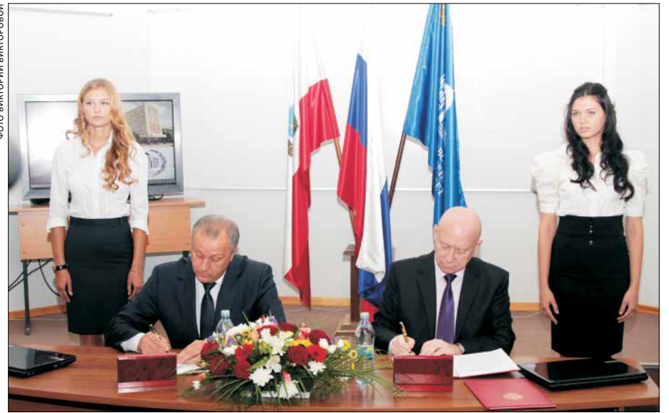
Договор о сотрудничестве с Правительством Саратовской области – важнейший шаг по укреплению партнёрских отношений и доказательство признания достижений СГУ

В ходе реализации Программы развития НИУ СГУ существенно выросла роль университета как социального института, который в результате научного поиска создаёт условия