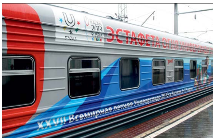
Символ XXVII Всемирной летней Универсиады привезли в Саратов из Пензы на специальном поезде