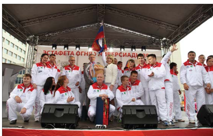
В завершение мероприятия гости передали памятные факелы Правительству Саратовской области и Саратовскому университету