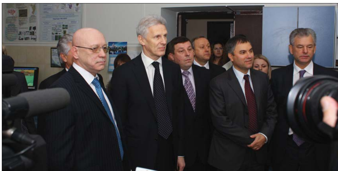
ОНИ наноструктур и биосистем стал одним из центров инновационного развития. Разработки и направления исследований Института в юбилейный год были представлены всем гостям университета

Росло число заказчиков коммерческих образовательных услуг: за год университет заключил соответствующие договоры более чем с 70 учреждениями, предприятиями и организациями. В число новых партнёров СГУ вошли министерство образования Саратовской области, Саратовский юридический институт МВД России, Саратовский медицинский колледж, ОАО «Российские железные дороги», ОАО «Саратовстройстекло», ОАО «Саравиа» и другие. В Саратовский университет обращались не только светские учреждения: сотрудники СГУ осуществляли повышение квалификации по заказу Саратовской епархии Русской Православной Церкви и медресе «Шейх Саид» Духовного управления мусульман Саратовской области. В программе повышения квалификации государственных служащих Саратовской области налаживались связи с преподавателями Московского государственного института международных отношений. Всего в 2009 году общее число обучившихся в СГУ по программам дополнительного профессионального образования, с учётом научно-педагогических работников, прошедших повышение квалификации за счёт средств федерального бюджета, составило 1593 человека. И ещё 2979 студентов университета получали дополнительные квалификации. Такие высокие показатели сферы дополнительного профессионального образования СГУ ещё не знала.