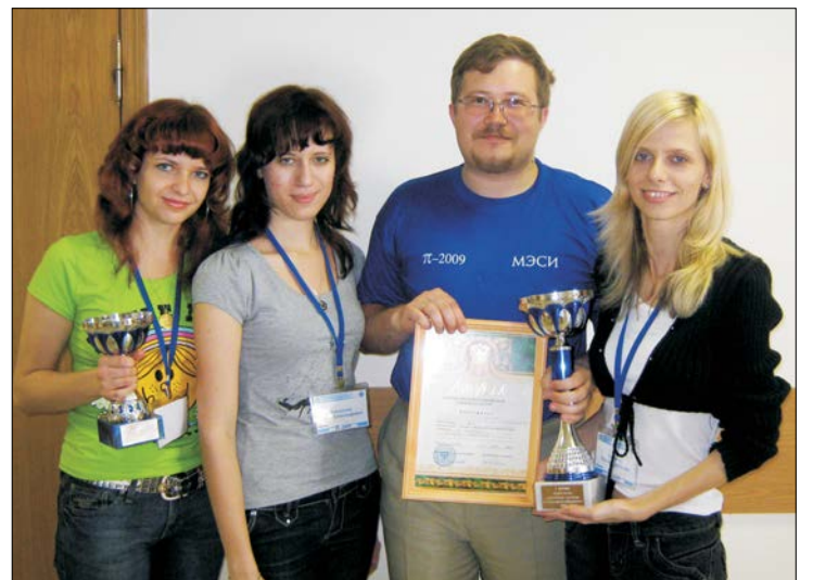
В юбилейный год студенты СГУ достойно представляли свой родной университет на фестивалях и конкурсах самого разного уровня