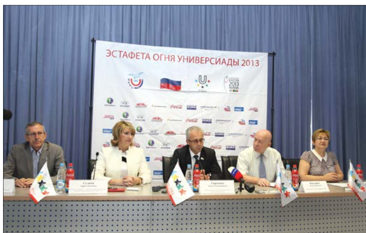
На пресс-конференции рассказали о маршруте Огня Универсиады: после Саратова он отправится в Самару, затем в Оренбург и Уфу