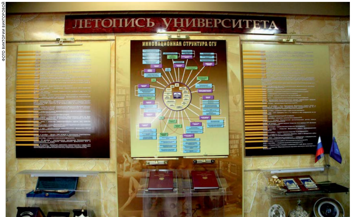
Год столетнего юбилея СГУ встретил в статусе инновационного вуза с развивающейся инфраструктурой: образовательные институты и факультеты, центры, лаборатории, малые предприятия

Продолжилось становление Института химии, решение о создании которого было принято на исходе 2008 года. Институт образовался в результате укрепления связей с предприятиями химического, нефтехимического профиля и появления на кафедрах значительного числа разработок внедренческого характера. В рамках новой структуры оказалось возможным модернизировать принципы подготовки специалистов с учётом рейтинга специальностей, специализаций и особенностей