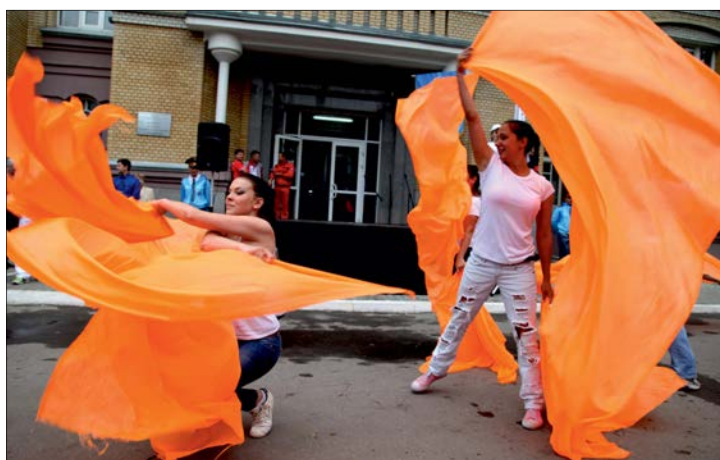
Артисты Студенческого клуба культуры СГУ в своём танце показали красоту огненной стихии