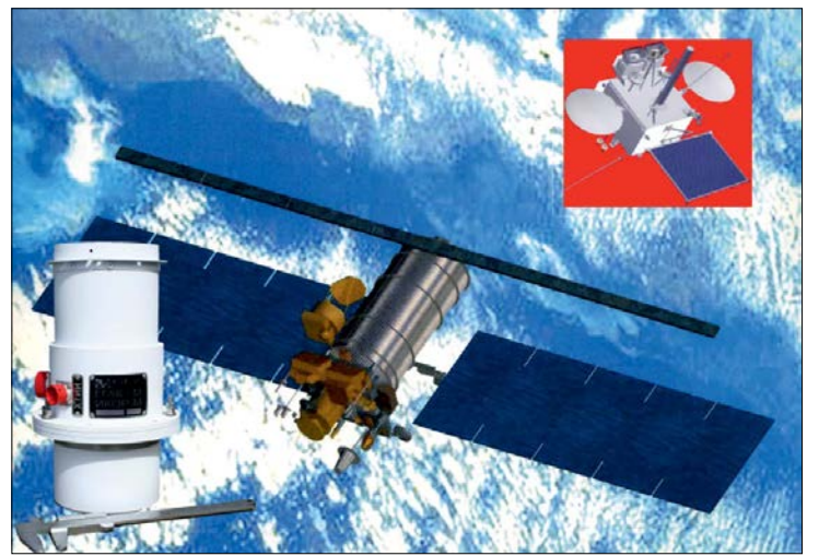
Измеритель коротковолновой отражённой солнечной радиации «ИКОР-М» на борту спутника «Метеор-М»

В сентябре начал работу Центр открытого образования, моделирующий процессы обучения на расстоянии. Его создание позволило университету работать не только с областными районными