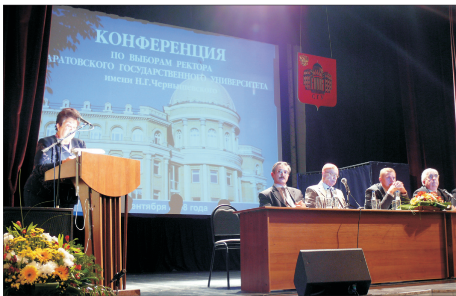
В ходе прений на конференции выступали профессора, сотрудники, студенты Саратовского государственного университета