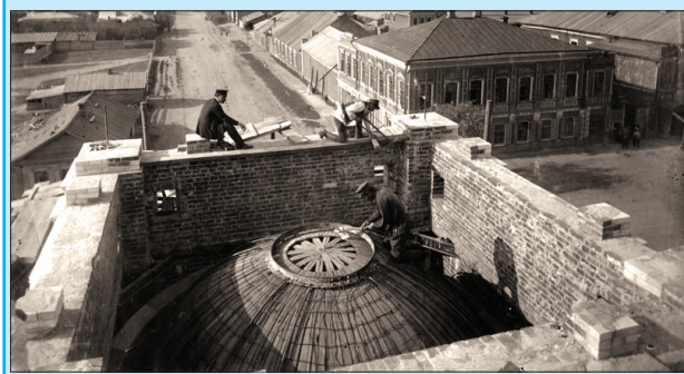
Монтаж купола часовни анатомического института. Фото 1912 г.