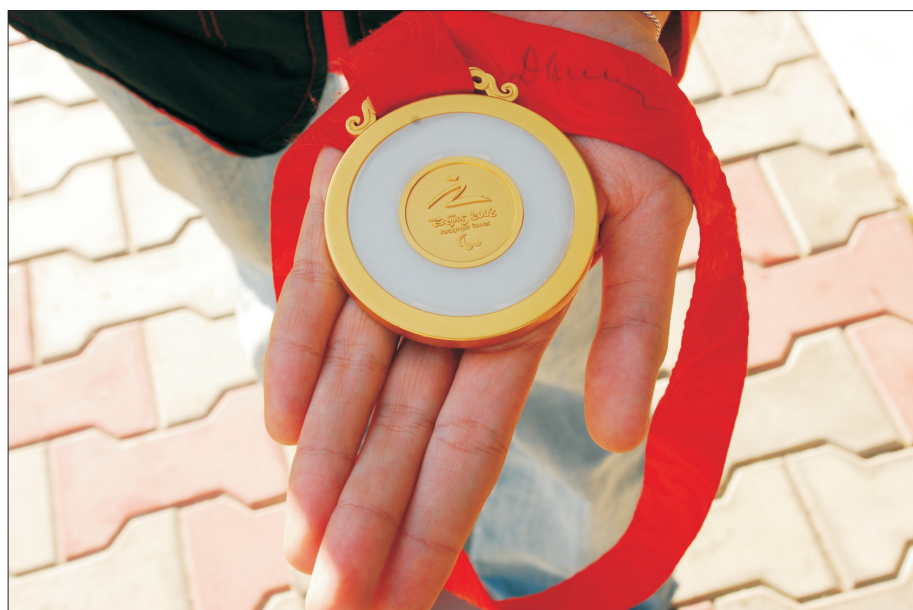
Президент России Дмитрий Медведев оставил автограф на олимпийской ленточке. Он просто написал своё имя – «Дима»

Все новости о жизни СГУ – на портале www.sgu.ru