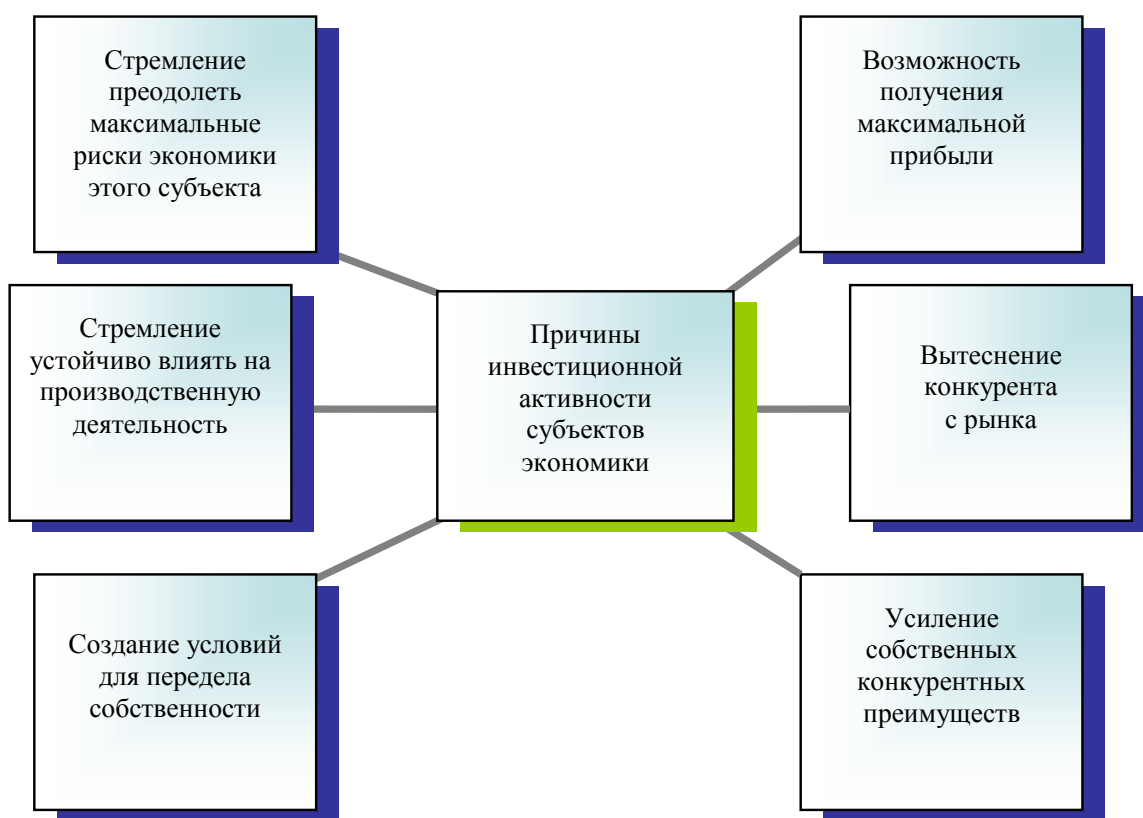
Рис. 1. Причины инвестиционной активности субъектов экономики вне связи со степенью привлекательности инвестиционного климата

климат и инвестиционная активность являются интегральными ресурсами этого субъекта экономики, поскольку они резко повышают собственную конкурентоспособность. Соотношение инвестиционной активности и привлекательности инвестиционного климата должны быть одновременно стабильными и гибкими, поскольку соотносятся со всеми названными выше причинами, их различным сочетанием. Их стабильность и гибкость связаны с тем, что должны учитываться изменения, происходящие в политической, социально-экономической ситуации бытия субъектов экономики. Активизируются и инвестиционные процессы, и инвестиционный климат, если экономика данного субъекта хозяйствования формируется как инновационная, по вектору развития венчурного капитала, прикладной и фундаментальной науки.