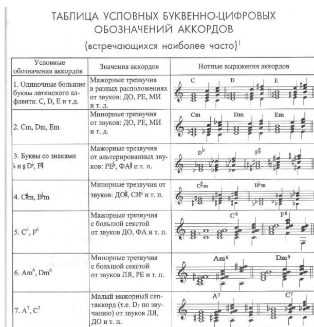
Рис. 1. Таблица буквенно-цифровых обозначений аккордов

allargando – алларгандо – расширяя, замедляя rubato – рубато – ритмически свободно marcato – маркато – подчёркивая, выделяя una corda – уна корда – взять левую педаль tre corde – трэ корде – снять левую педаль non troppo – нон троппо – не слишком tranquillo – транкуилло – спокойно, безмятежно cantabile – кантабиле – певуче calando – каландо – стихая, уменьшая силу звука scerzando – скерцандо – шутивно, игриво agitato – ажитато – возбуждённо, взволнованно maestoso – маэстозо – величественно, торжественно appassionato – аппассионато – страстно energico – энэргико – энергично, сильно, решительно con forza – кон форца – с силой con spirito – кон спирито – с увлечением, с жаром, воодушевлённо con brio – кон брио – живо, с огнём amoroso – аморозо – любовно, нежно, страстно grazioso – грациозо – грациозно, изящно sotto voce – сотто воче – вполголоса espressivo – эспрессиво – выразительно, экспрессивно subito – субито – сразу, внезапно comodo – коммодо – удобно, непринуждённо sempre – сэмпрэ – всегда, всё время, постоянно simile – симиле – точно так, как раньше assai – ассаи – весьма, очень