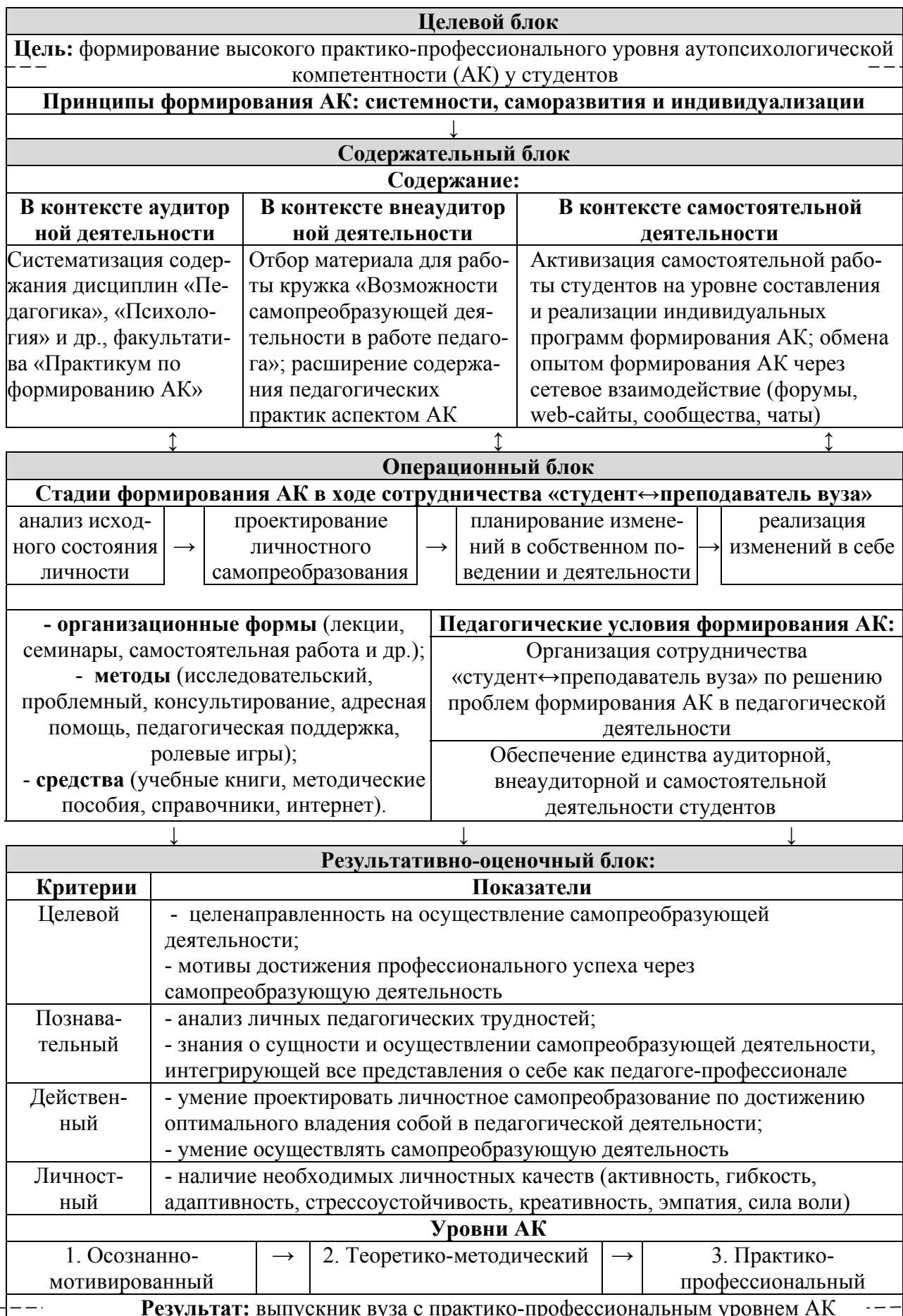
Рисунок 1 - Модель формирования АК студентов педагогических специальностей вуза