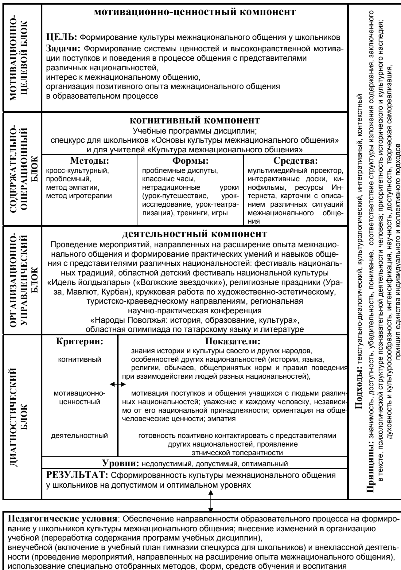
Рисунок 1 - Модель формирования культуры межнационального общения у школьников