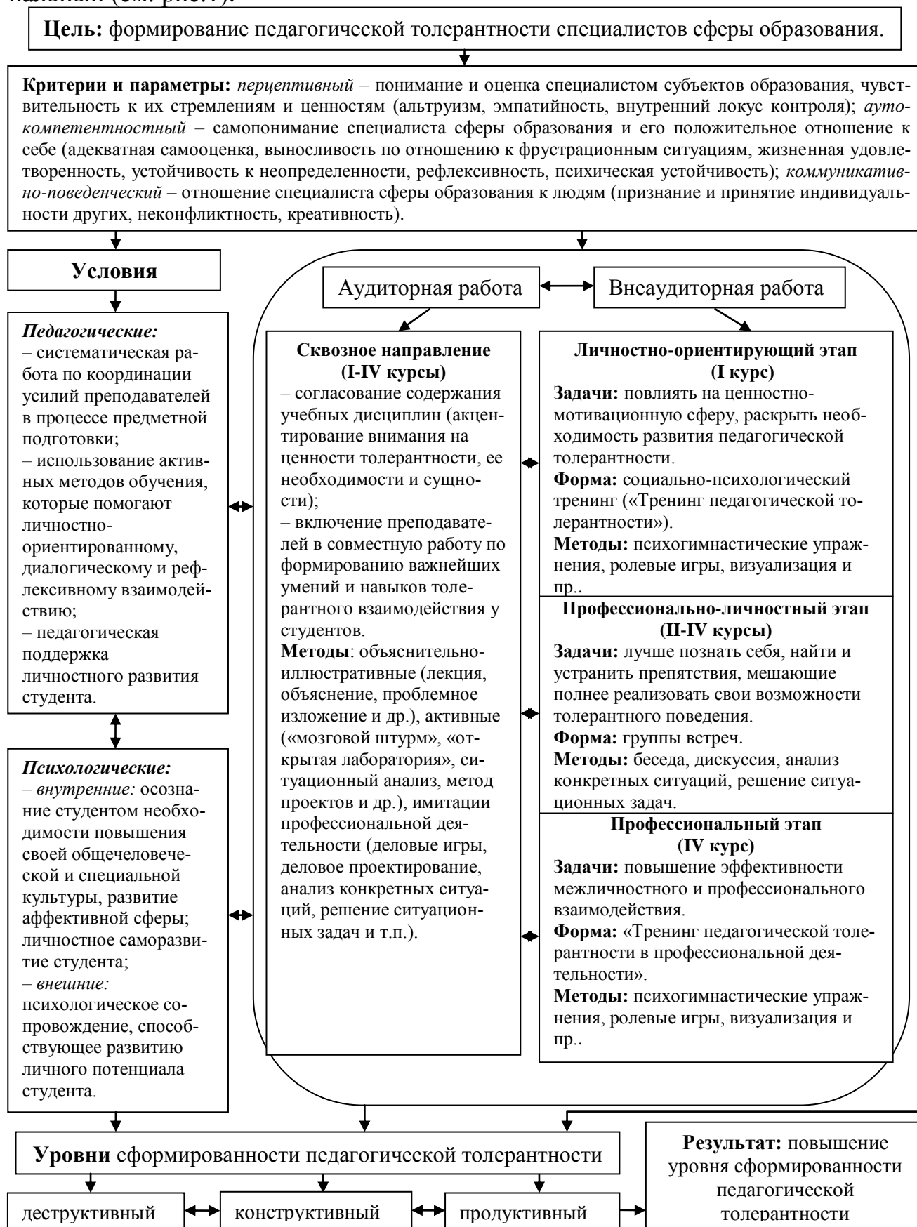
Рис.1 Модель формирования педагогической толерантности будущих специалистов сферы образования

В структуре модели выделены три последовательных и взаимосвязанных этапа: личностно-ориентирующий, профессионально-личностный и профессиональный (см. рис.1).