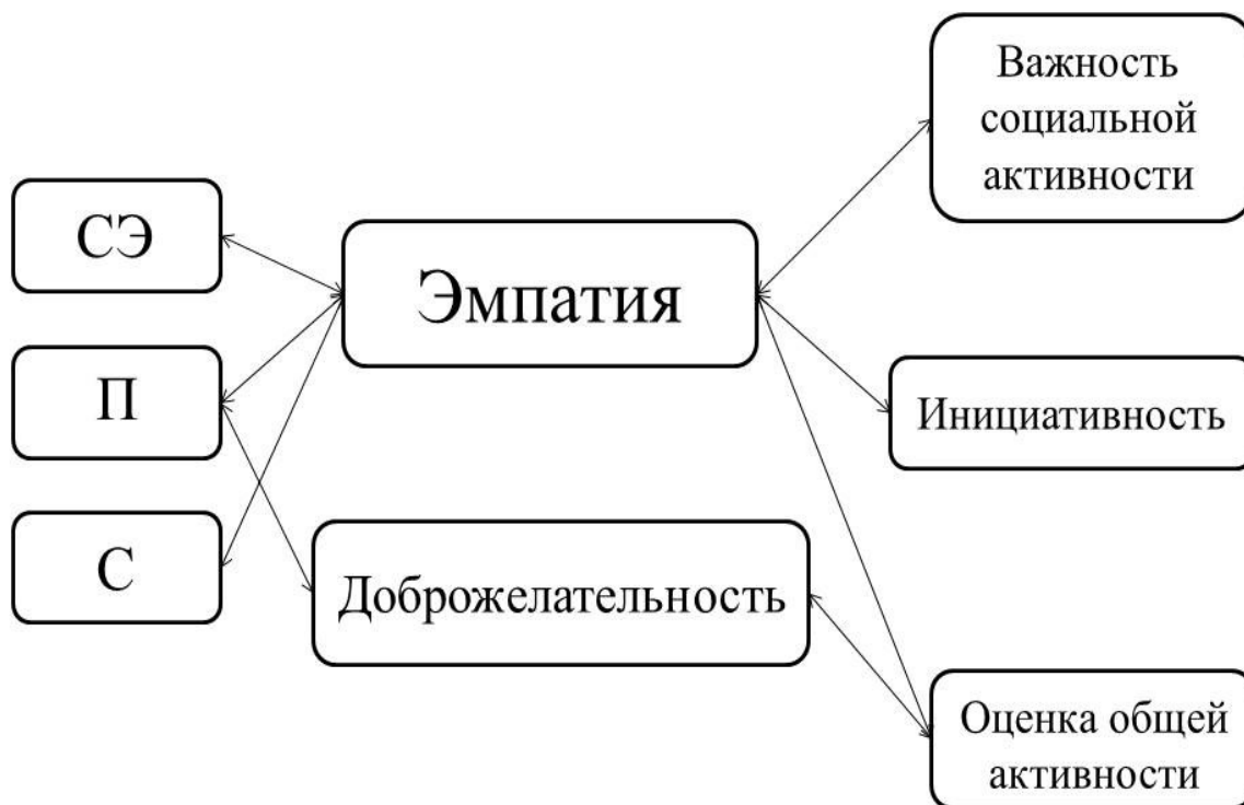
Рисунок 3. Взаимосвязи различных форм и общих параметров социальной активности, индивидуально-психологических качеств обучающихся, приводящие к понижению общего уровня социальной активности

В рамках изучения наиболее важных для социальной активности качеств был проведен корреляционный анализ уровня рефлексии и социальной активности обучающихся среднего и старшего звена школы. Установлено, что рефлексия значимо и прямо взаимосвязана с оценкой общей активности (частоты) ( r = 0,157 , при p < 0,05 ). Также рефлексия имеет прямую значимую взаимосвязь с такими формами социальной активности, как образовательно-развивающая ( r = 0,221 , при p < 0,01 ) и культурная активность ( r = 0,158 , при p < 0,05 ). Становится понятно, что чем более эффективно субъект активности воспринимает и анализирует отклик среды на собственную активность, тем выше её частота и направленность личности на познание и развитие.