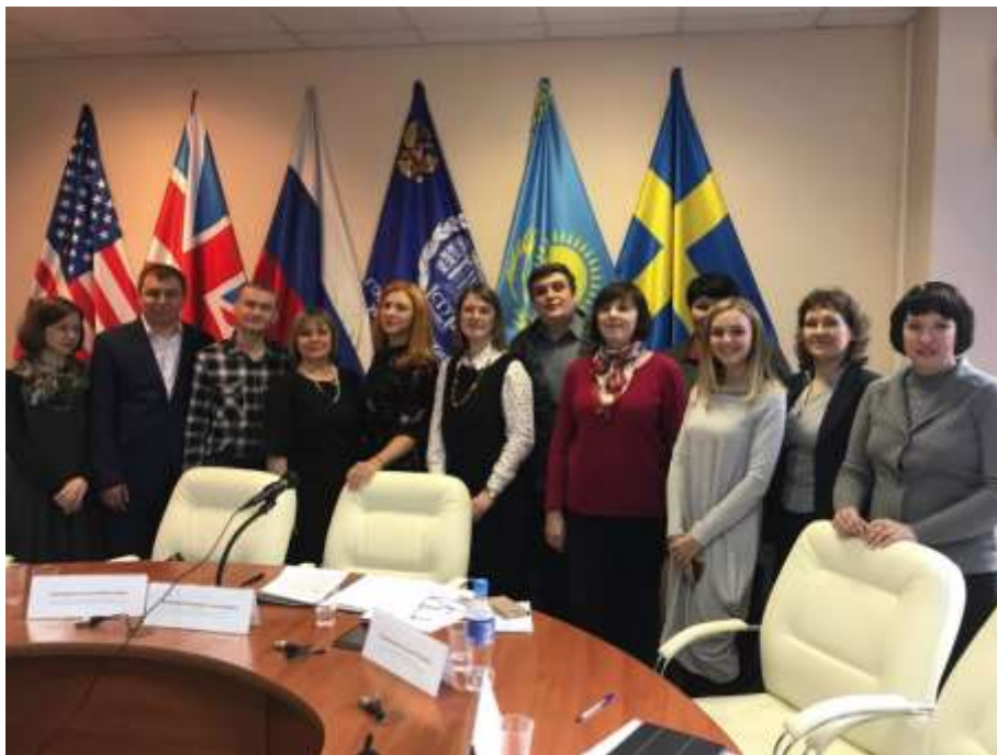
Семинар-практикум «Проектирование стратегических линий развития системы содействия трудоустройству выпускников с ОВЗ и инвалидностью» 26 апреля 2018 г.

Экспертно-проектная сессия «Региональная программа сопровождения инвалидов молодого возраста при получении ими профессионального образования и дальнейшего трудоустройства: поиск совместных решений» 17 октября 2019 г.