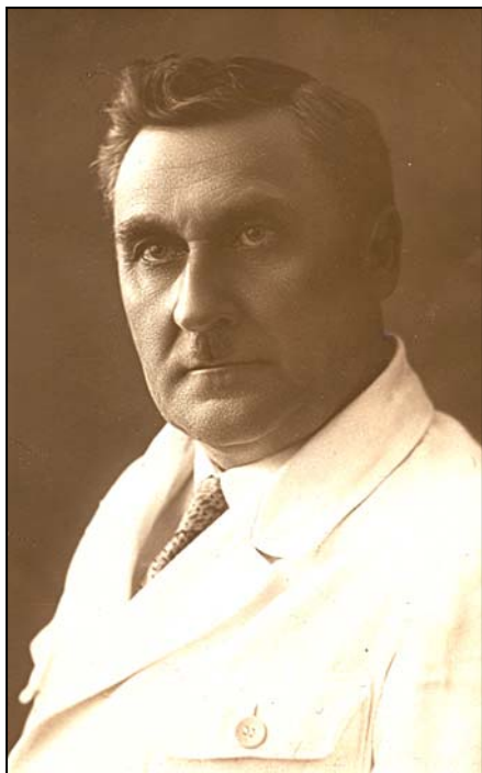
П.С. Рыков – декан истфака СГУ. Фото 1937 г. Публикуется впервые

П.С. Рыков был искренне предан любимому делу – археологии, не являлся кабинетным археологом, «чиновником от образования» или «конформистом от науки». Как активно работающий археолог-полевик, он многие годы проводил лето не в отпусках, а в экспедициях. Обширные материалы его раскопок, существенная часть которых до сих пор полностью и должным образом не опубликована, составляют золотой фонд археологических источников юго-востока Европы. Работы Павла Сергеевича внесли существенный вклад в изучение культурного наследия первобытных и средневековых народов Нижнего Поволжья. Его фундаментальные исследования общепризнанны специалистами, поэтому и сейчас широко используются отечественными и зарубежными археологами.