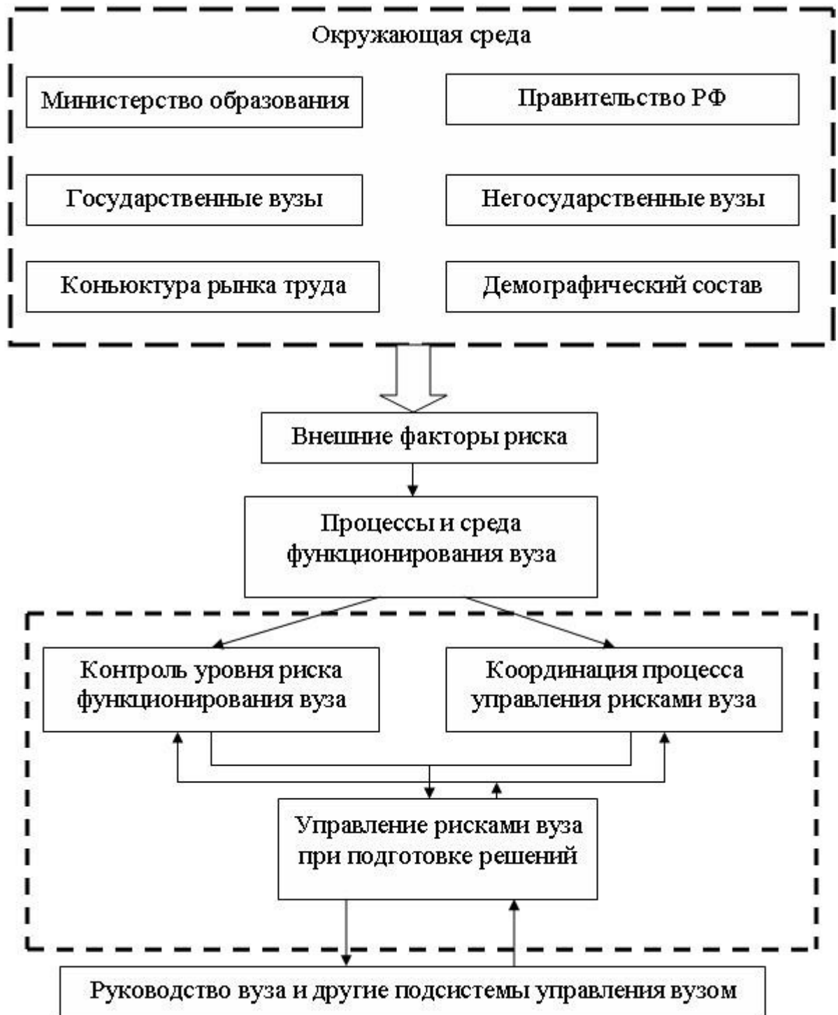
Рис. 2. Структура управления рисками в вузе