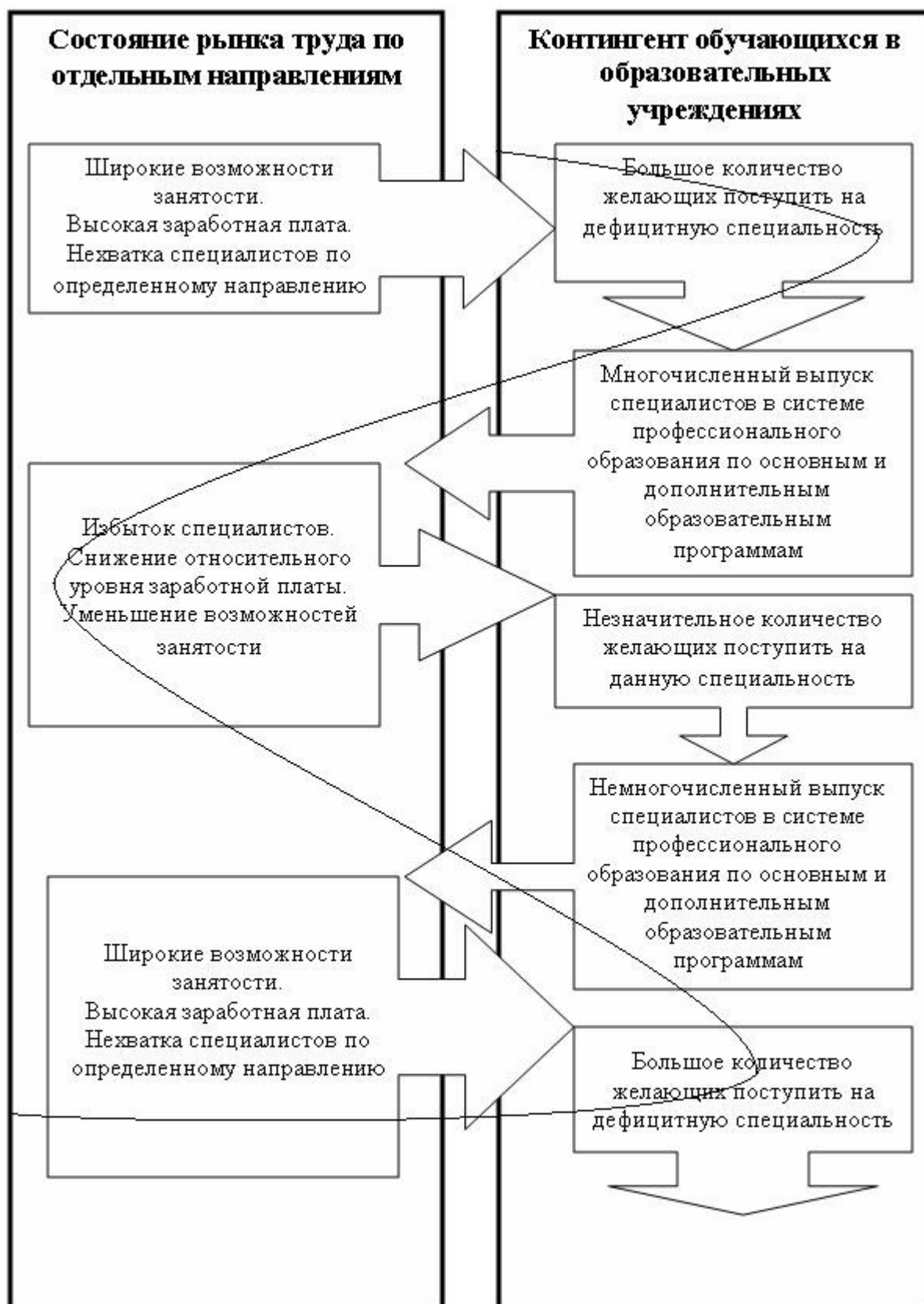
Рис. 4. Фазы волнового процесса колебаний конъюнктуры рынка труда и образовательных услуг