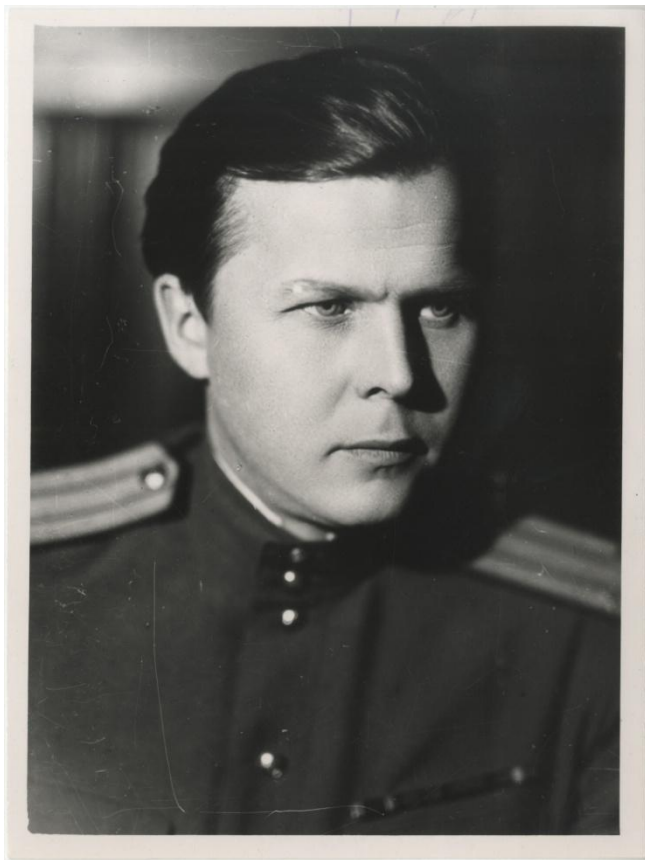
Фотография А. Т. Твардовского работы М. С. Наппельбаума. Начало 1940-х гг.

21 июня 2020 года исполняется 110 лет со дня рождения Александра Трифоновича Твардовского, поэта и прозаика, журналиста, главного редактора журнала «Новый мир», автора книги «про бойца без начала, без конца» – поэмы «Василий Тёркин», получившей всенародное признание, лучшей книги о войне, написанной на войне и удостоенной в 1946 году Сталинской премии первой степени.